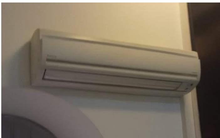
1. Klima uređaj Daikin FTX 50