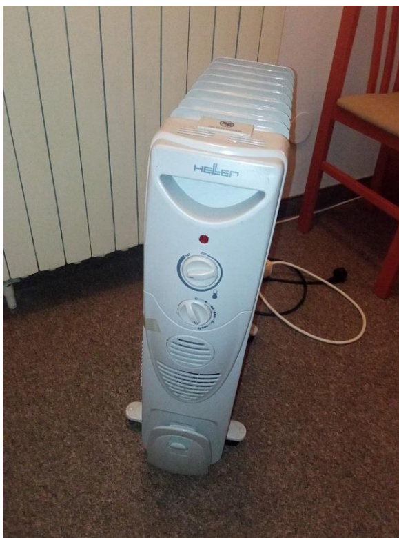
15. radijator Heller