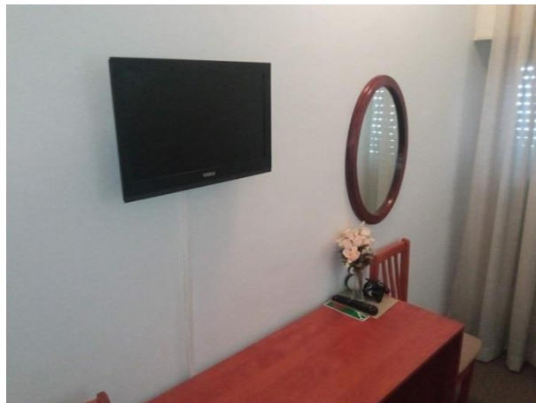
13. TV Grundig Vision 26"